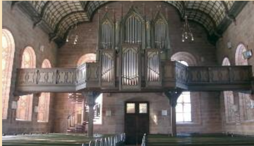
Veranstalter: ev. Kirchengemeinde Bad Herrenalb